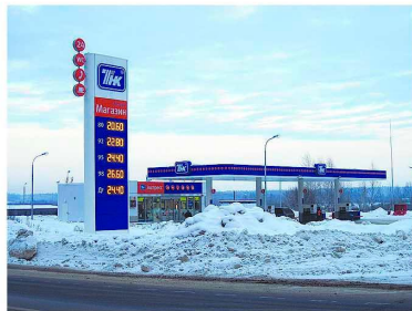
АЗС 46, Трасса М8, 145 км, право. Строительство 2010 года.

Нами построены АЗС для компаний «Газпромнефть», «Славнефть», «ТНК», «Роснефть», частных инвесторов в г. Ростов, г. Переславль, г. Вологда, г. Ярославль, п. Петровск Ярославской области.