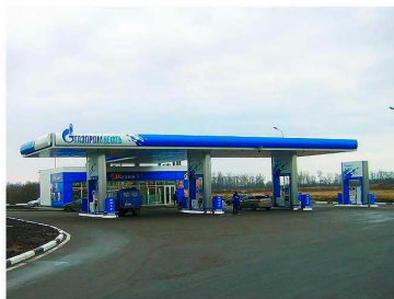
АЗС 12, Трасса М8, 135 км, право. Строительство 2010 года.