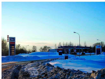
АЗС 39, Трасса М8, 180 км, лево. Строительство 2010 года.