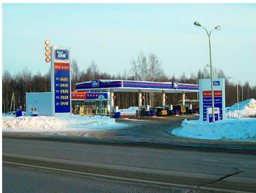
АЗС 44, Трасса М8, 180 км, право. Строительство 2010 года.