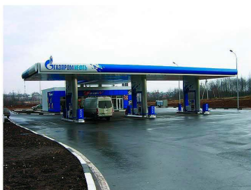
АЗС 8, Трасса М8, 209 км, право. Строительство 2010 года.

Производственные мощности позволяют вести строительство до 5-ти АЗС одновременно. За пять лет существования строительного направления накоплен большой опыт как руководящими работниками подразделения, так и специалистами среднего и низшего звена.